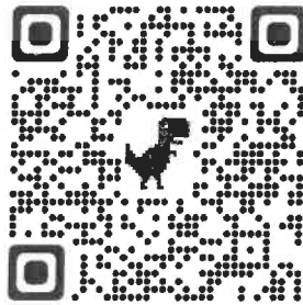
Slika 3. QR code JP "Olimpijski bazen Otoka" d.o.o.

https://bazen.ba/novi-termini-obuke-spasilaca-na-uredjenim-plivalistima/