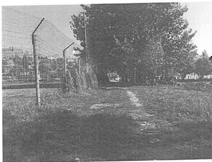
Mjesto nekadašnje grobnice na groblju Sveti Josip

Također, potrebno je napomenuti da još uvijek postoji određen broj ekshumiranih, a neidentifikovanih žrtava.