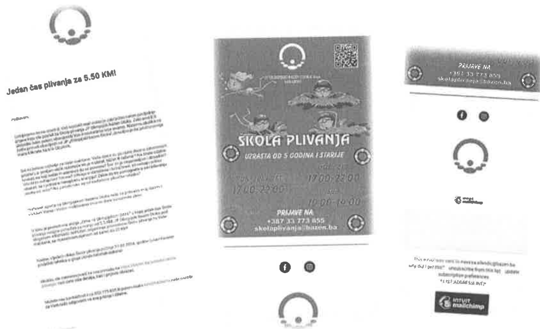
Slika - Prikaz izgleda newsletter-a

https://onasa.ba/2024/05/10/olimpijski-bazen-otoka-15-i-30-maja-pocinju-novi-ciklusi-kole-plivanja-2/