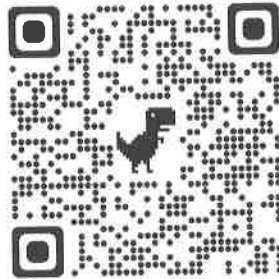
Slika 3. QR code JP "Olimpijski bazen Otoka" d.o.o.

https://bazen.ba/novi-termini-obuke-spasilaca-na-uredjenim-plivalistima/