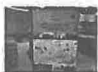
Održana promocija knjige „Prvi korpus u odbrani Sarajeva 1992. – 1995.“

Nadamo se da ćemo sa izabranim nosiocima vlasti na svim nivoima, kao i do sada, raditi na izgradnji jake i prosperitetne Države Bosne i Hercegovine.