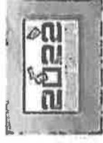
povodu početka predizborne kampanje u Bosni