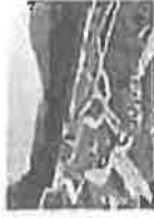
Zaustaviti aveti fašizma u Mostaru

udruženjima logoraša USK, Savezu udruženja boraca Patriotske lge BiH, kao i predstavnicima Institucija i organa vlasti sa kojima smo do sada obavili razgovore.