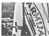
General Atif Dudaković i član Predsjedništva BiH dr Denis Bećirović su časne patriote