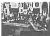
Predstavnici Udruženja na okupljanju veterana u povodu neustavnog djelovanja od strane rukovodstva bh entiteta "Rs"

Zbog ovako dostojanstvenog nastupa gradonačelnice Benjamine Karić i njenih patriotskih stavova Udruženje generala Bosne i Hercegovine joj daje punu podršku i odaje priznanje. Našim stavovima pridružili su se SUB Patriotska Liga Bosne i Hercegovine, kao i Udruženje „Žene borci 92.-95.“ Kantona Sarajevo.