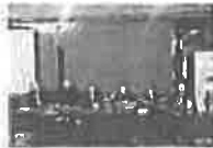
Druga press konferencija - Rad Tužilaštva Bosne i Hercegovine

Formirana "Inicijativa za zaštitu i očuvanje Istine o odbrambenoj borbi i ratu 1992. – 1995. – IZBOR