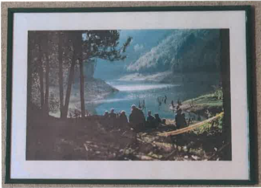
18. Foto color - ram zeleni 50x70 cm

Ukupno 124 tijela i dio jednog tijela otkriveni su na mjestu koje je u oktobru 2000. godine ekshumirano. Ova je lokacija nazvana Slap 1. Nekoliko kilometara nizvodno pronađena je još jedna grobnica, nazvana Slap 2, u kojoj je bilo ukopano sedam tijela. Do danas 119 osoba je identifikovano.