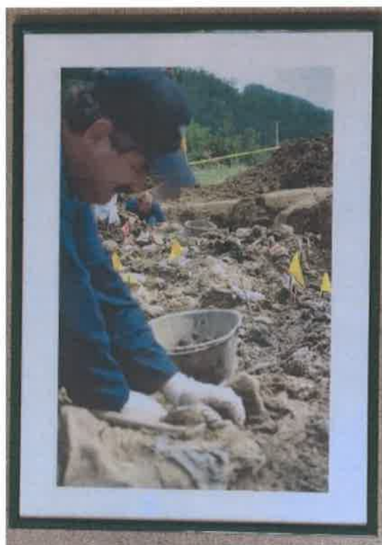
03. Foto - color - ram - metal zeleni 50x70 cm

Jedna od 13 masovnih grobnica žrtava čiji su posmrtni ostaci pronađeni ubijena je nakon pada Srebrenice u julu 1995. godine. Grobnica Cancari, kao i sve druge lokacije u okolini sela Kamenica, predstavlja sekundarnu masovnu grobnicu.