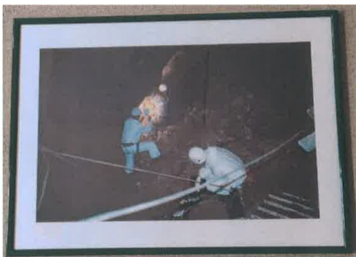
28. Foto color – zeleni ram 50x70 cm

Traganje u jami traje danima, odvoz nagomilanog materija je teško izvlačiti pa se gomila na drugu slobodnu stranu jame