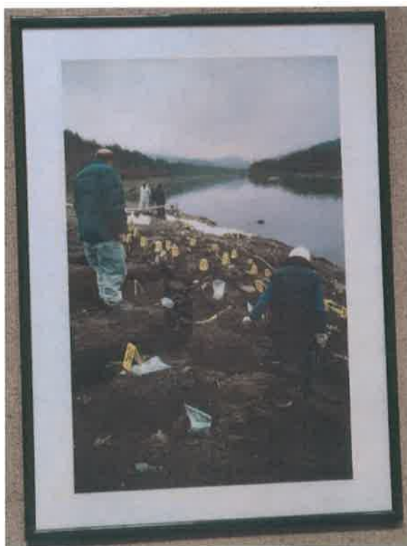
23. Foto color ram zeleni 70x50 cm

Samo iz Višegrada, odakle je i najveći broj do sada identificiranih, kao nestalo vodi se više od 600 Bošnjaka, oni su najvećim dijelom završili u Drini. Ali nisu samo Bošnjaci iz Višegrada bacani u Drinu, već i iz Rogatice, Foče, Rudog, Srebrenice, Žepe, Zvornika, Bratunca, pa čak je bilo i tijela Bošnjaka iz Priboja i Prijepolja, riječ je o onim Bošnjacima koji su skinuti iz autobusa u Sjeverinu, selu između Priboja i Rudog, i onih skinutih iz voza u Štrpcima.