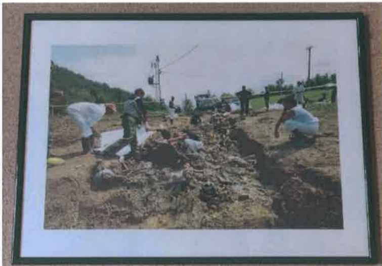
Masovna grobnica ( Cancari) Kamenica 2. August 2002