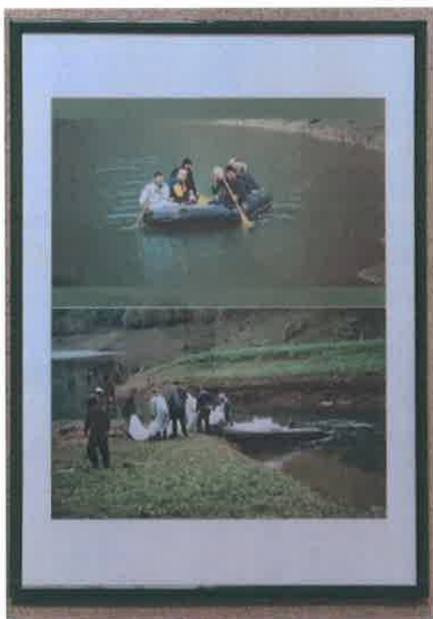
14. Foto ram zeleni 70x50 cm

Sudije, istražitelji i forenzičari ponekad imaju samo jedan način da dođu do mjesta ekshumacije. Masovna grobnica Žepa-Slap 2000 g.