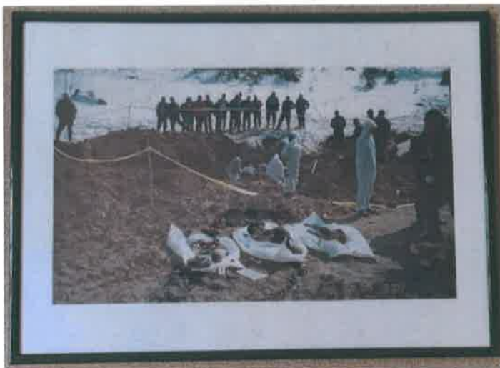
08. Foto color - ram zeleni 50x70 cm

Iščekivanje -- je vrijeme koje traje nekad i sedmicama. Porodice koje tragaju za tračkom nade da čuju bilo kakvu vijest o svojim najbližim koji su nestali neumorno stoje i nijemo gledaju u zemlju ne bili dobili bilo kakav znak . Uzdah na grobnici i nada u očima. Nadpolje 2000 .g.