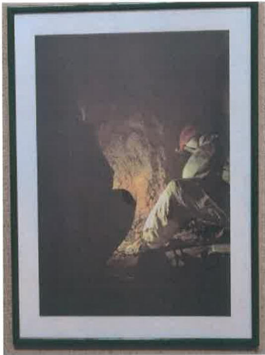
20. Foto color ram zeleni 70x50 cm

Rad u jami traje satima ...temperatura je oko 10 C a vlažnost je velika...ekspertni tim i dr Eva Klonovski na prikupljanju posmrtnih ostataka 81m jama Borisavac