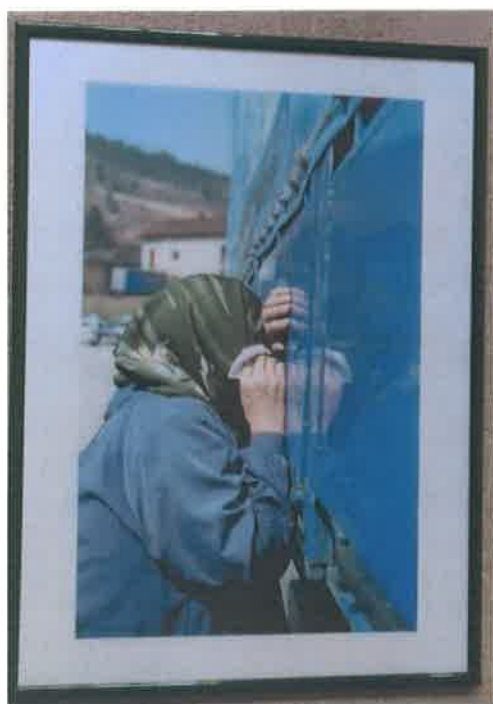
15. Foto color ram zeleni 70x50 cm

Sudije, istražitelji i forenzičari ponekad imaju samo jedan način da dođu do mjesta ekshumacije. Masovna grobnica Žepa-Slap 2000 g.