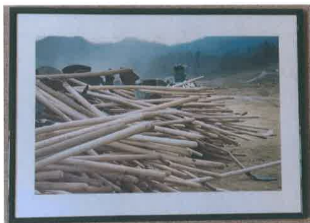
02. Foto - color - ram - metal zeleni 50x70 cm

Na kraju dana - poslije ukopa nešto više od 600 žrtava genocida 1995. u Potočarima se uz buku i jeku nekoliko desetina hiljada ljudi, porodica ,putnika namjernika, posjetilaca, žena, djece i staraca zadesi tišina i dženaza se pretvori u vjetar sa prašinom i muk nesnosni.“ Odložene lopate poslije ukopa u Potočarima 11.07.2005