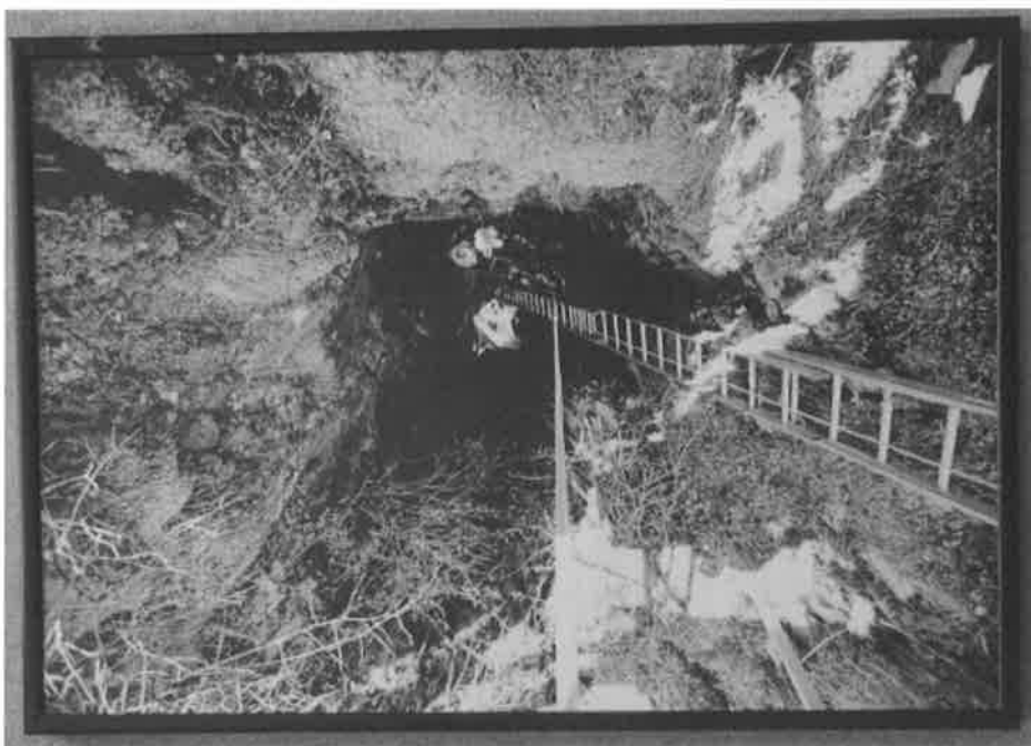
Ulazak u jamu – zapadna Bosna jama Ravnice - Bihać BW05