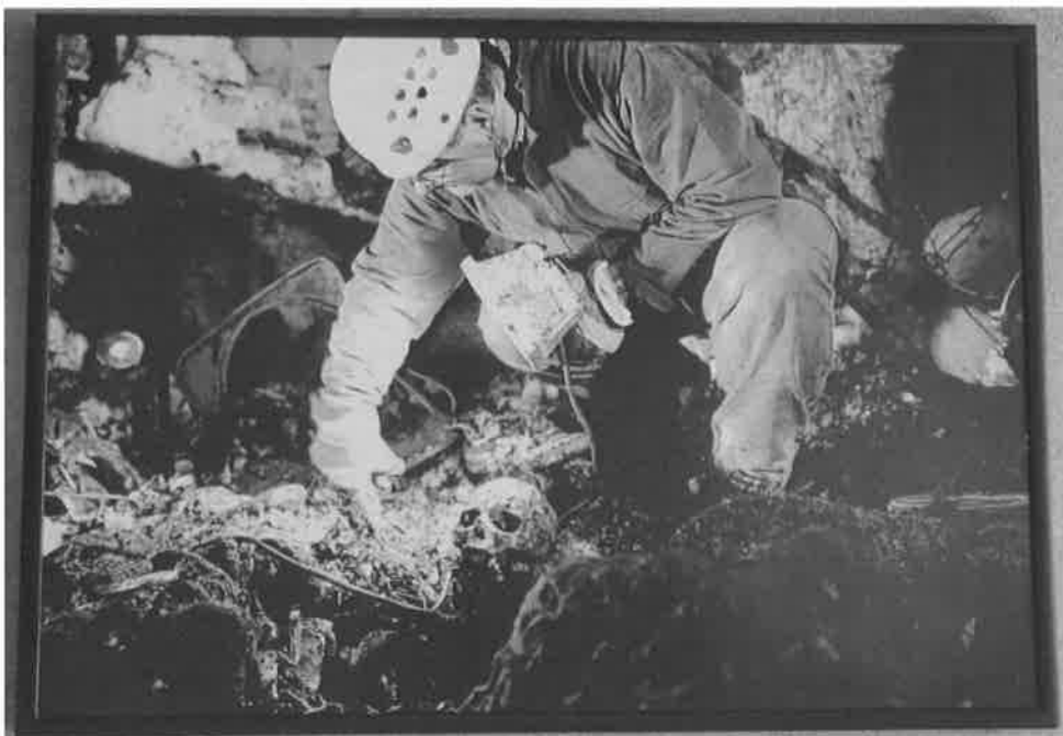
Na dnu....ukazani ostaci bačenih civila u jamu Sjemeć – Rogatica 2007 BW04