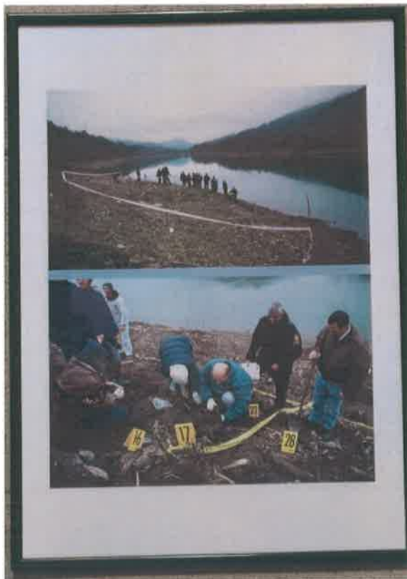
19. Foto color ram zeleni 70x50 cm

Obala Drine - Kod sela Kurtalići ekshumacija posmrtnih ostataka civila iz okolnih sela likvidirani na obali i potopljeni jezerom. Ekshumacija decembar 2000.g.