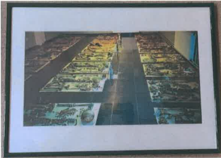
Dijelovi skeleta iz masovne grobnice su spremni za identifikaciju. Prosektura u Visokom 2009