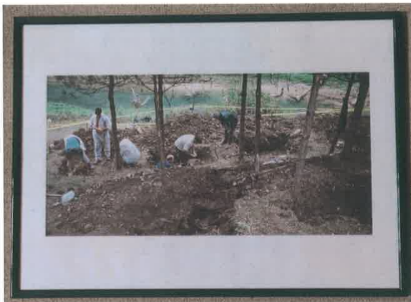
22. Foto color - ram zeleni 50x70 cm

Informacije o lokaciji masovne grobnice dao je jedan od lokalnih stanovnika koji su ukopali plutajuća tijela izvučena iz Drine nakon što su isplivala nizvodno iz pravca Višegrada. Slap – žepa