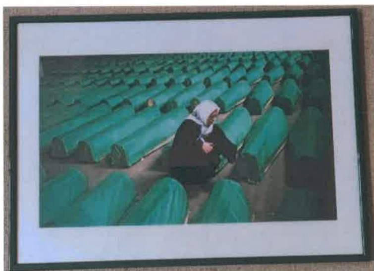
09. Foto color ram zeleni 50x70 cm

Umorne od čekanja, nepravde i samoće koju niko za sve ove godine nije mogao nadomjestiti.