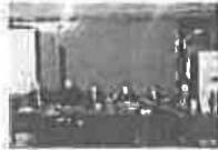
Druga press konferencija - Rad Tužilaštva Bosne i Hercegovine

Formirana "Inicijativa za zaštitu i očuvanje Istine o odbrambenoj borbi i ratu 1992. – 1995. – IZBOR