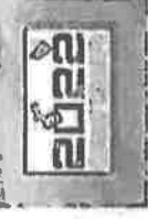
povodu početka predizborne kampanje u Bosni