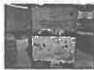
Održana promocija knjige „Prvi korpus u odbrani Sarajeva 1992. – 1995.“

Nadamo se da ćemo sa izabranim nosiocima vlasti na svim nivoima, kao i do sada, raditi na izgradnji jake i prosperitetne Države Bosne i Hercegovine.