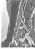
Zaustaviti averti fašizma u Mostaru

udruženjima logoraša USK, Savezu udruženja boraca Patriotske lige BiH, kao i predstavnicima institucija i organa vlasti sa kojima smo do sada obavili razgovore.