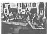
Predstavnici Udruženja na okupljanju veterana u povodu neustavnog djelovanja od strane rukovodstva bh entiteta "Rs"

Zbog ovako dostojanstvenog nastupa gradonačelnice Benjamine Karić i njenih patriotskih stavova Udruženje generala Bosne i Hercegovine joj daje punu podršku i odaje priznanje. Našim stavovima pridružili su se SUB Patriotska liga Bosne i Hercegovine, kao i Udruženje „Žene borci 92.-95.“ Kantona Sarajevo.