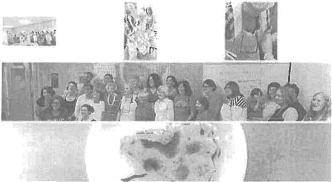
St.Luise Cooking class, 2017.

Udruženje je učestvovalo na Diplomatskom zimskom bazaru predstavljanjem Bosanske sefardske kuhinje