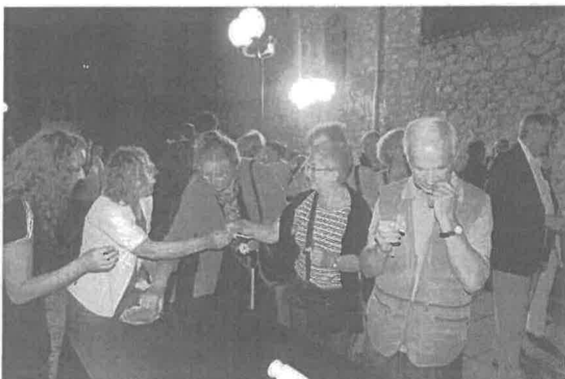
06.07. 2023. godine JU BKC KS, atrij 20:30 sati