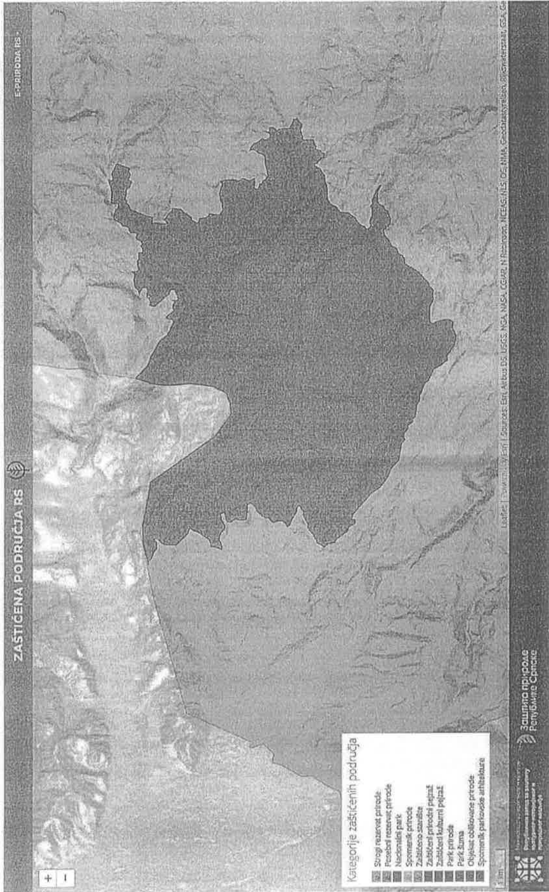
Prilog II: Prostorni obuhvat Parka prirode „Trebević”2