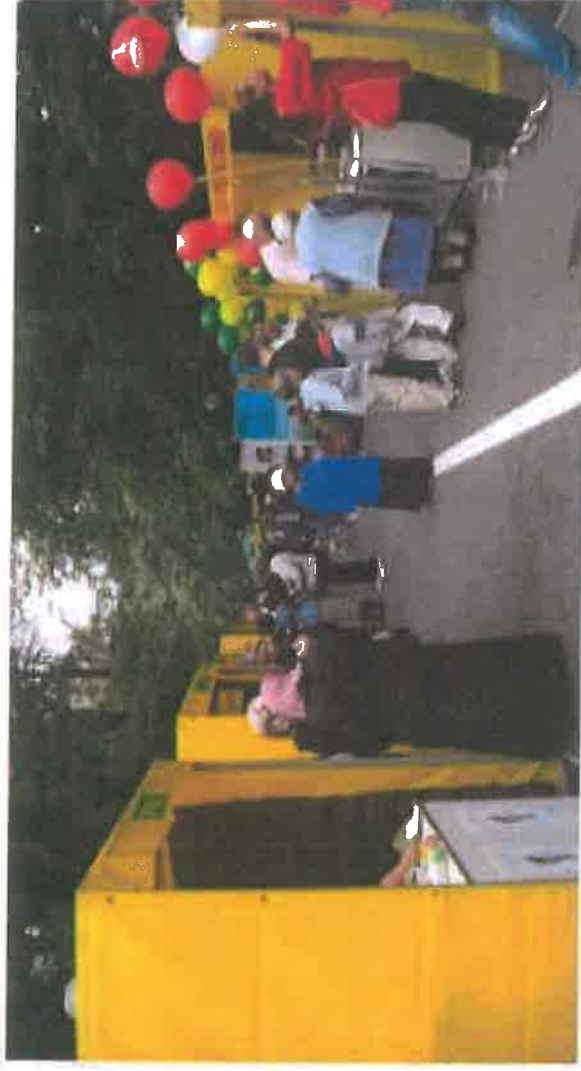
Sajam Vilsonovo šetalište