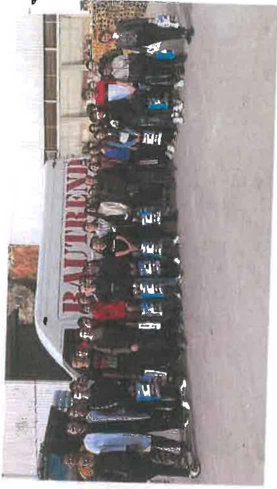
Učenci OŠ "Malta" posjetili Rajz d.o.o. & Bautrend