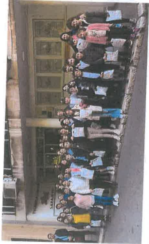
Učenci OŠ "Čengić Vila 1" posjetili tvornicu čarapa Kijuč Sarajevo