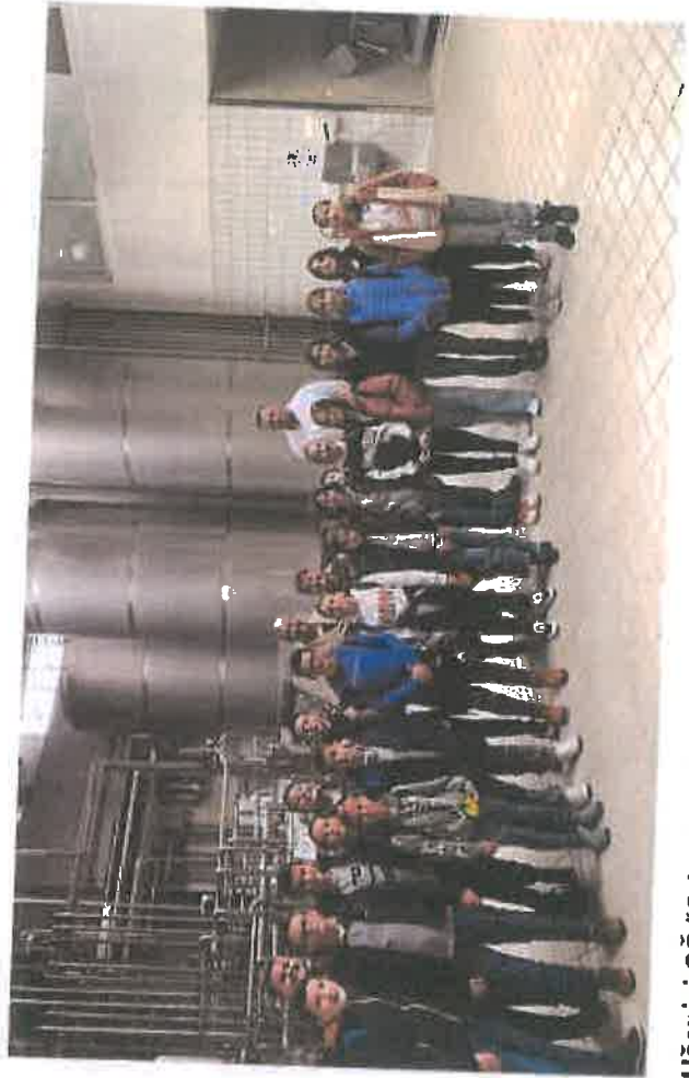
Učenici OŠ "Grbavica 1" posjetili Milkos d.d.