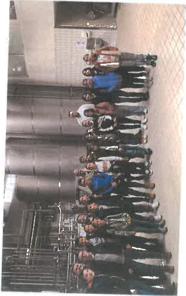
Učenci OŠ "Grbavica 1" posjetili Miikos d.d.