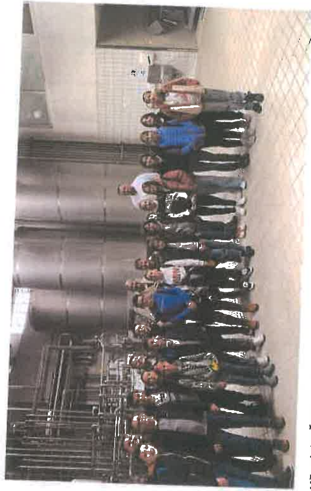
Učenci OŠ "Grbavica 1" posjetili Milkos d.d.