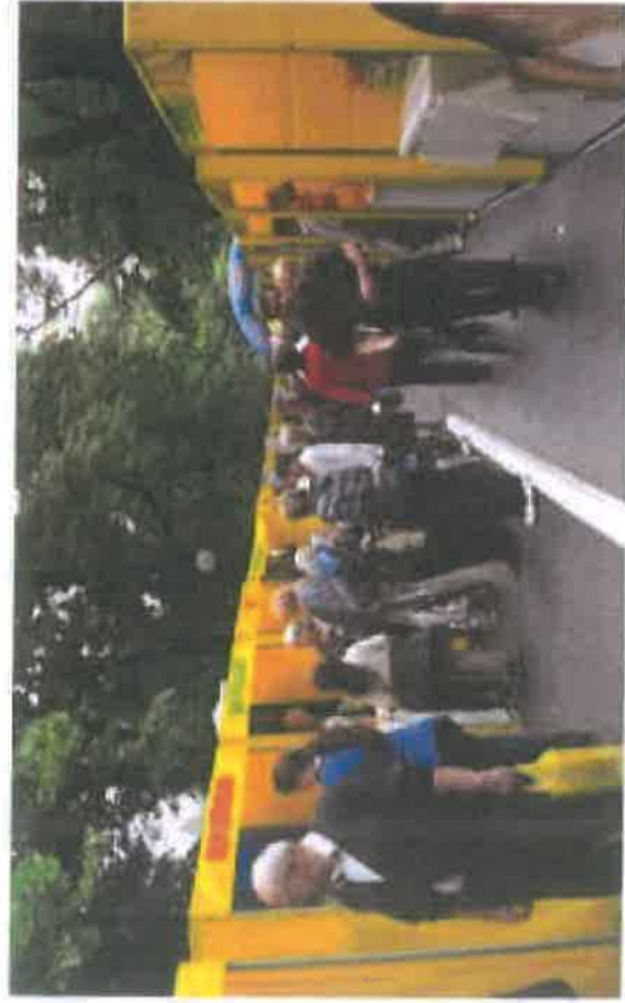
Sajam Vilsonovo šetalište