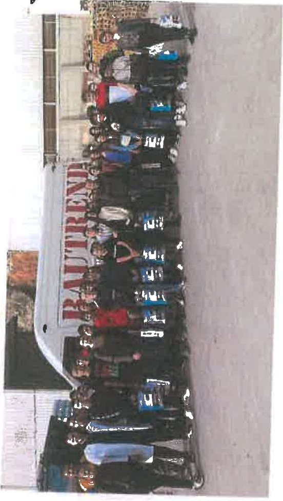
Učenci OŠ "Malta" posjetili Rajz d.o.o. & Bautrend