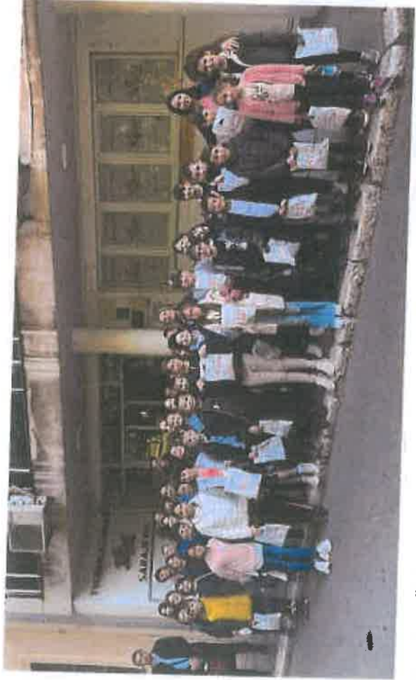
Učenci OŠ "Čengić Vila 1" posjetili tvornicu čarapa Kijuč Sarajevo