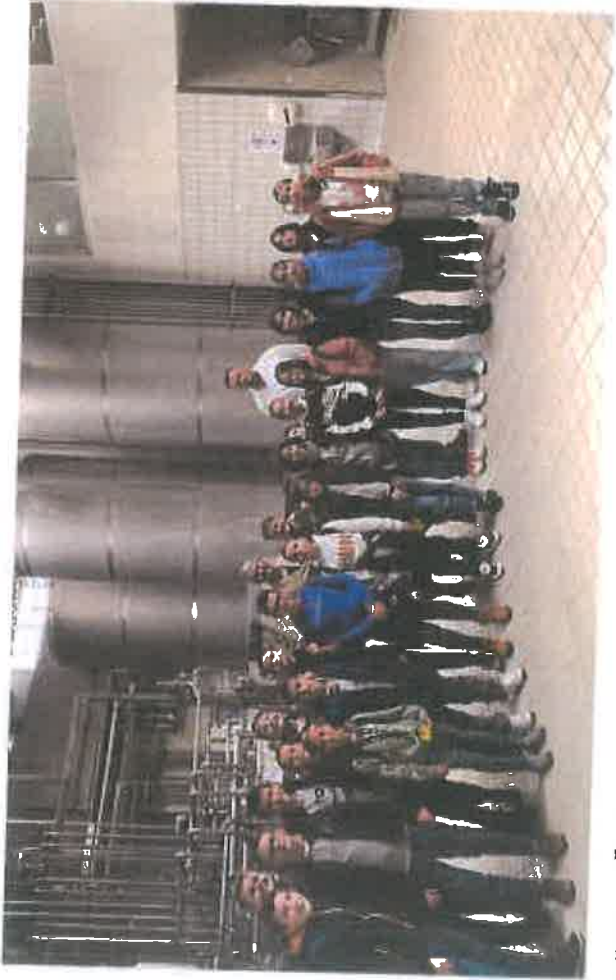
Učenci OŠ "Grbavica 1" posjetili Milkos d.d.