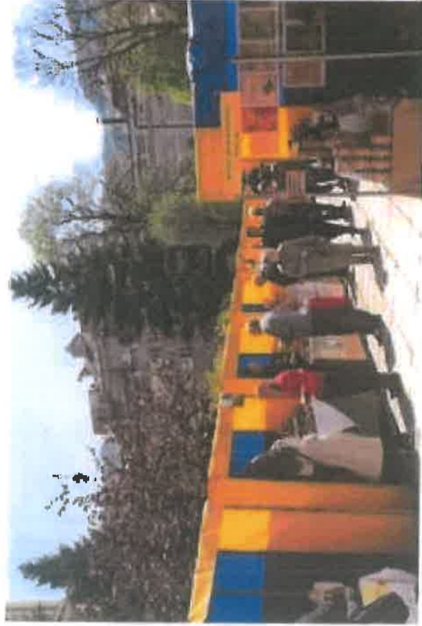
Sajam Trg Alije Izetbegovića