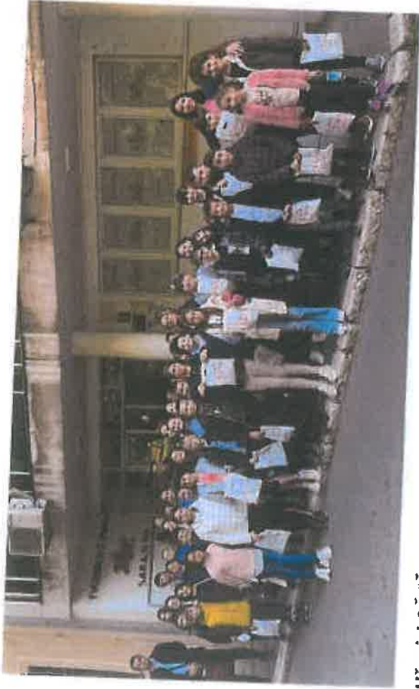
Učenci OŠ "Čengić Vila 1" posjetili tvornicu čarapa Ključ Sarajevo