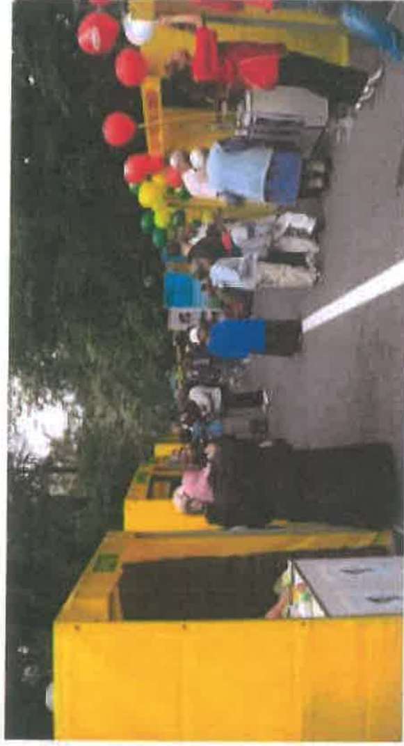
Sajam Vilsonovo šetalište