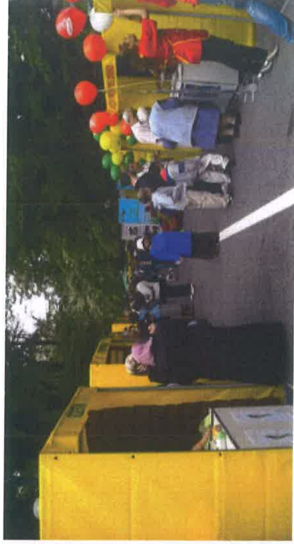
Sajam Vilsonovo šetalište