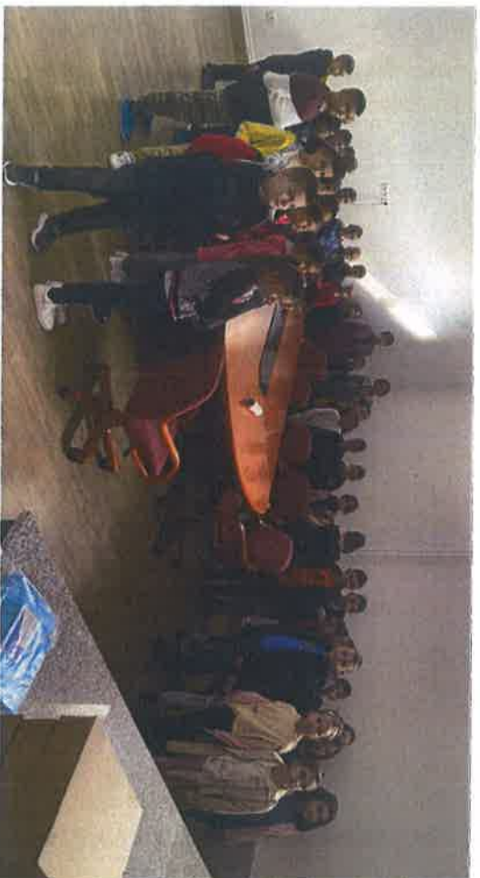
Učenci OŠ "Porfalići" posjetili Fine Food