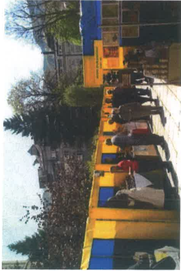
Sajam Trg Alije Izetbegovića