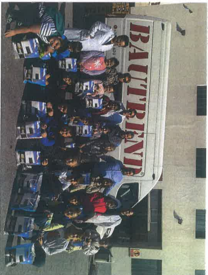
Učenci OŠ "Pofalci" posjetili Fine Food