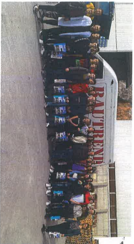
Učenci OŠ "Malta" posjetili Rajz d.o.o. & Bautrend