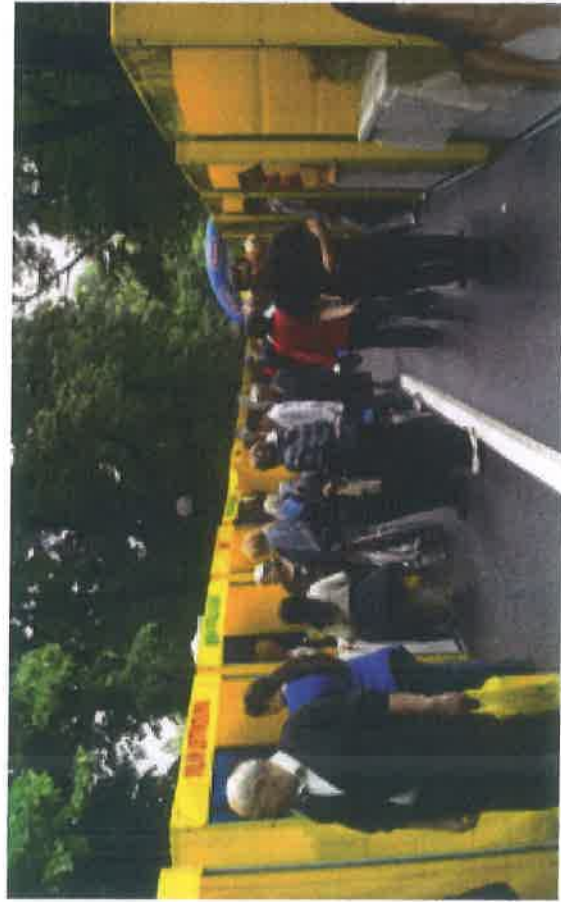
Sajam Vilsonovo šetalište