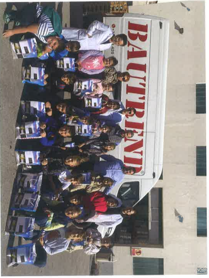
Učenici OŠ "Pofalici" posjetili Fine Food