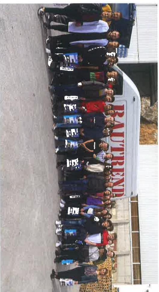
Učenci OŠ "Malta" posjetili Rajz d.o.o. & Bautrend