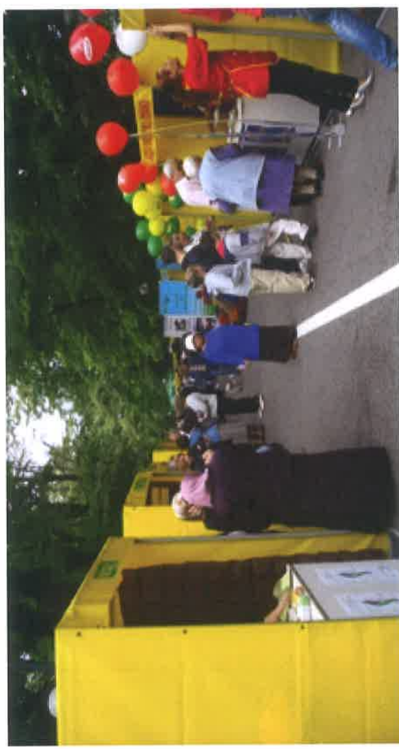
Sajam Vilsonovo šetalište