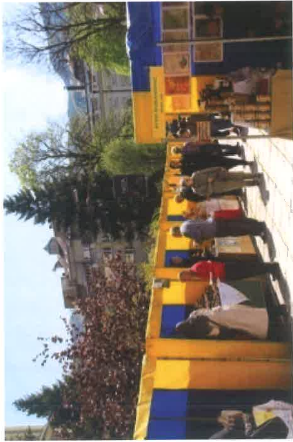
Sajam Trg Alije Izetbegovića