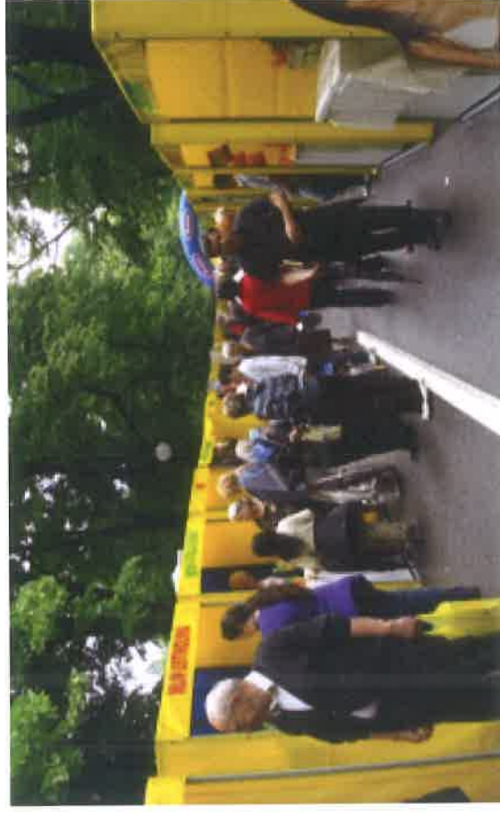
Sajam Vilsonovo šetalište