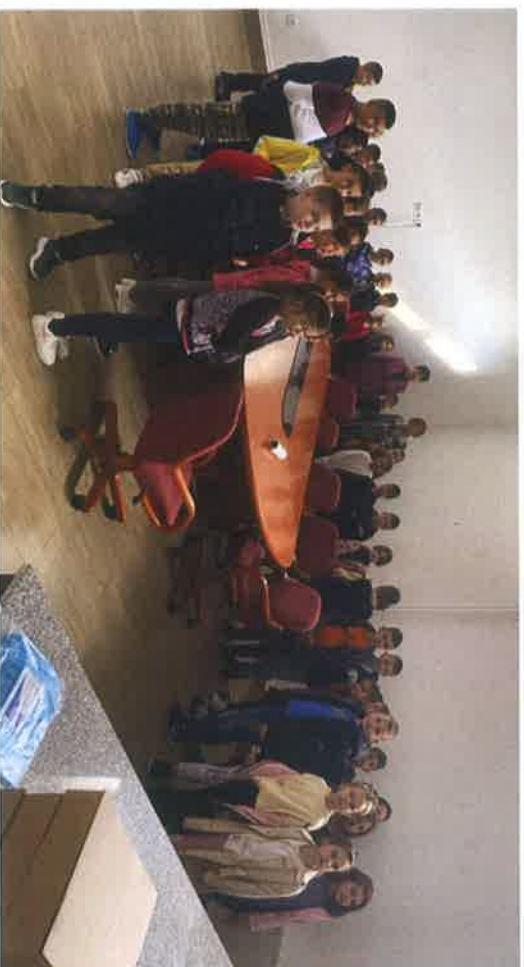
Učenci OŠ "Pofaliči" posjetili Fine Food