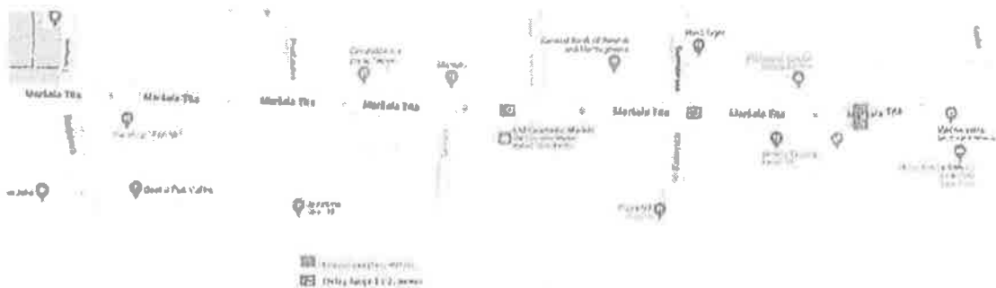
Slika 2 – Prikaz alternativne instalacije korištene opreme 1

Slike 2 i 3 prikazuju alternativne instalacije koje bi u slučaju instalacije 2 pokrile približno 2/3, a u slučaju instalacije 3 većinu željenog prostora. Instalacije 2 i 3 podrazumijevaju i pristup odnosno mogućnost da se takav sistem instalira.