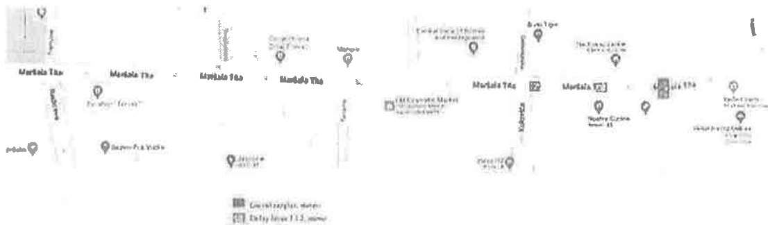
Slika 1 – Shematski prikaz instalirane opreme

Na slici 1 instalacija sugerira da je zona pokrivenosti zvukom oko 200 m ukupno ili približno 50% prostora dužine ulice Maršala Tita, od Vječne vatre do ulice Radićeva. Delay linije su postavljene na razmaku od 60 m što implicira da druga delay linija kao zadnja u nizu također ima pokrivenost 60 m što ukupno čini približno 200 m.