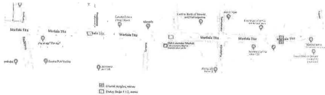
Slika 3 – Prikaz alternativne instalacije korištene opreme 2

Realne mogućnosti instalacije sistema mogu biti umanjene ograničenjima koja ima tehnički organizator odnosno angažirana razglasna kompanija, a sa druge strane može biti ograničena tehničkim mogućnostima i kreativnošću tehničkog organizatora odnosno angažirane razglasne kompanije. Ono što je pouzdano – prostor predviđen za publiku odnosno prostor koji treba biti ozvučen se može tehnički ozvučiti jer je to pokazala dosadašnja praksa.