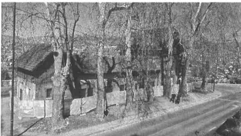
Fotografije tokom rekonstrukcije objekta 2020. g. i 2021. g.