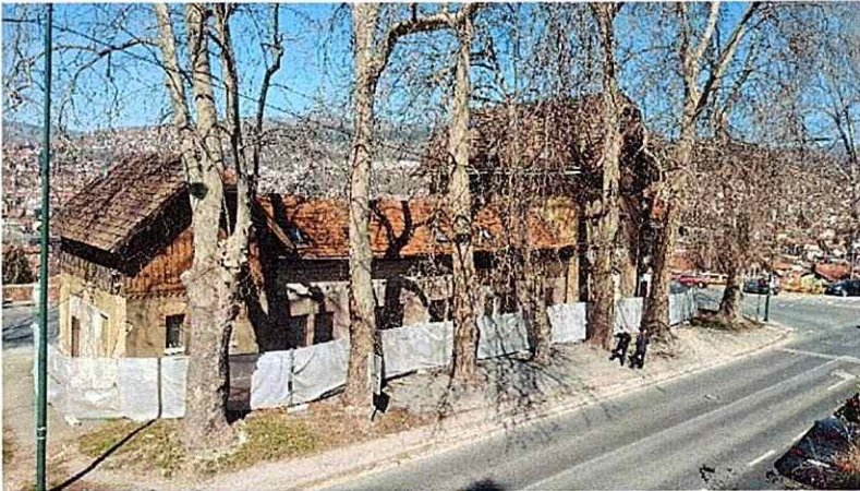
Fotografije tokom rekonstrukcije objekta 2020. g. i 2021. g.