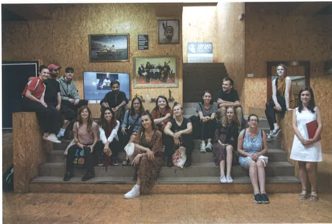
Polaznici Kuma International Summer School u Art Depou Ars Aevi