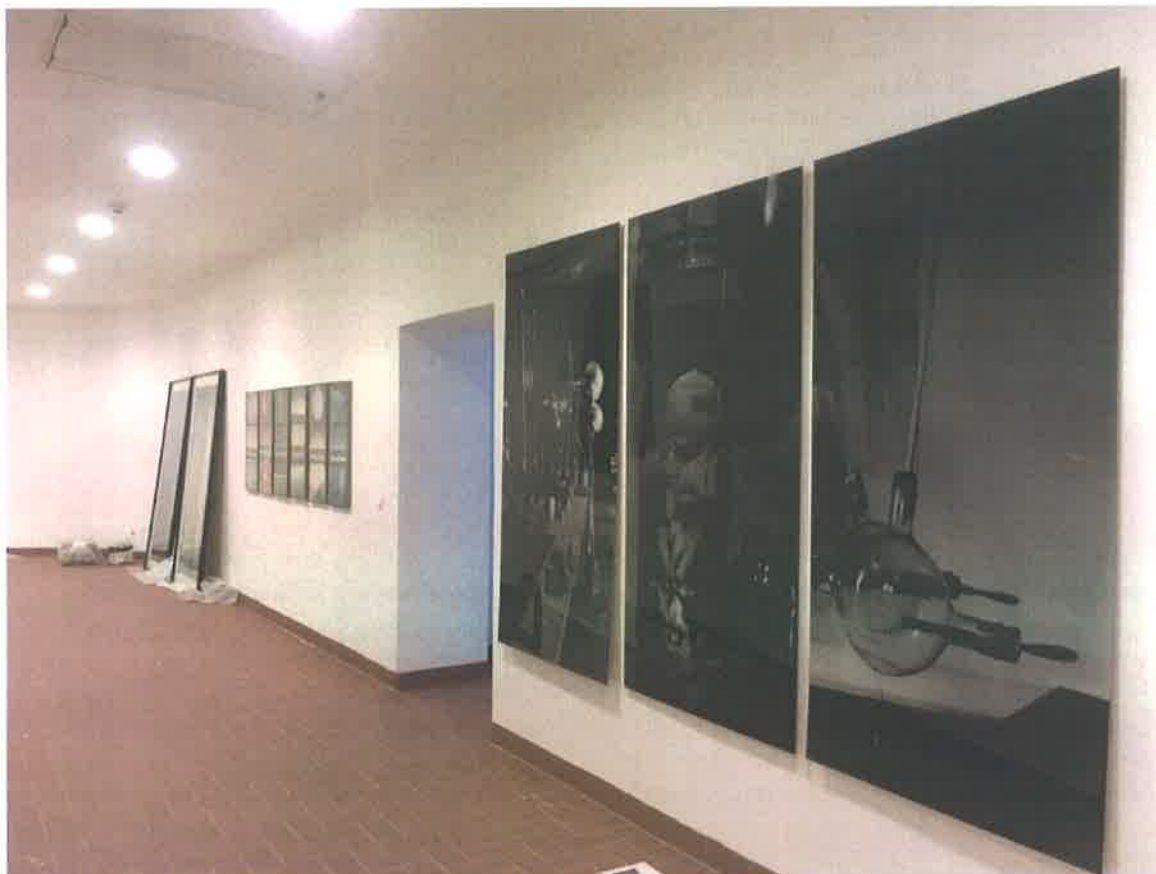
Izložbeni prostor u Vijećnici

U novom reprezentativnom prostoru Vijećnice na trećem i četvrtom spratu kolekcija neće biti izložena u punom kapacitetu, već samo odabrani radovi postojećih kolekcija, dok će ostatak biti deponovan. Krajem godine započeti su radovi na novoj postavci.