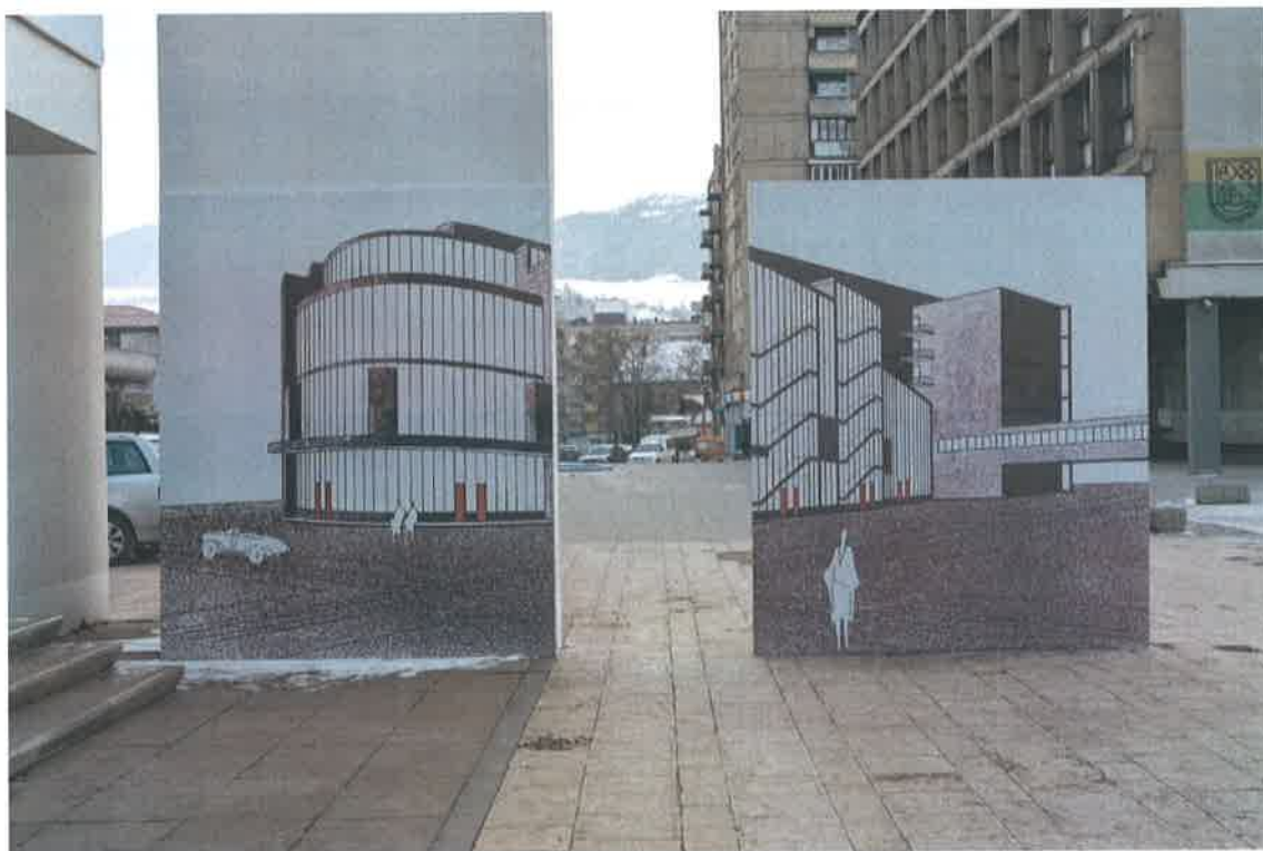
Zenica-Trilogija, fotografija, © Danica Dakic 2018.

Zenica-Trilogiju čine tri video rada “Čistač”, “Zgrada” i “Scena”, serija od šest grafičkih listova “Zenica-Mapa” i umjetnički objekt “Sirotanovička”, pozlaćeni originalni model lopate koja je nazvana po jugoslavenskom heroju radničke klase - radniku udarniku Aliji Sirotanoviću. Obzirom na specifičnost rada (site-specific), Ars Aevi tim je bio prinuđen naći novi prostor u kojem bi rad bio adekvatno izložen. Naš izbor je bila Palazzo Bernardo, venecijanska palata koja potiče iz 18. vijeka, u čijem se prizemlju nalazila radionica za izradu mozaika. Radi se o autentičnom primjerku venecijanske arhitekture koji je nedavno pretvoren u savremeni izlagački prostor pri čemu su se ispoštovani svi principi i elementi originalne građevine. Paviljon BiH predstavljen je u prizemlju palate, koje obuhvata šest prostorija površine 220 kvadratnih metara i otvoreni međusprat s dodatnih 100m 2 .