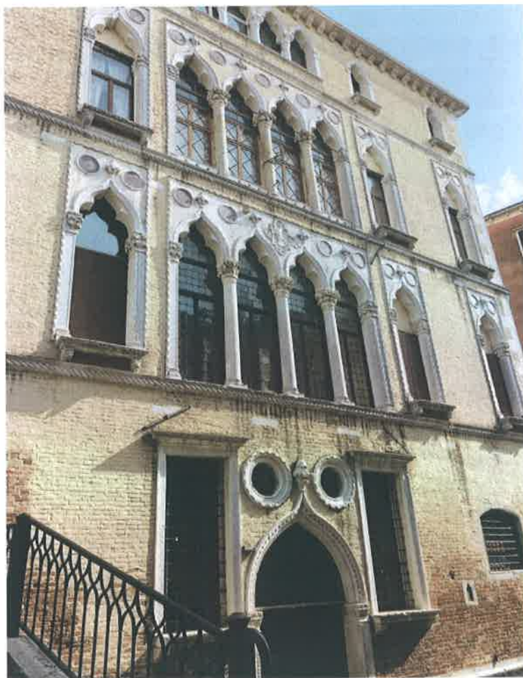
Palazzo Francesco Molon Ca' Bernardo

Zahvaljujući renovaciji i relevantnosti prostora za potrebe filmske instalacije Zenica-Trilogija, u ulaganja u prostor bila su minimalna. Palazzo Bernardo je u samom centru stare venecijanske gradske jezgre, u neposrednoj blizini se nalazi most Rialto koji je jedna od najpoznatijih i najposjećenijih kulturno-umjetničkih i turističkih lokacija grada Venecije. Nakon pronalaska prostora obavljani su sve tehničke i administrativne komponente koje su omogućile bh. izložbu. Nakon zvanične prijave Bijenalu, pažljivo je odabrano osoblje kojem smo povjerali naš paviljon u cjelokupnom trajanju bijenala. Zahvaljujući Ambasadi BiH u Rimu potpisan je ugovor i sve je bilo spremno za postavku i otvaranje paviljona u maju.