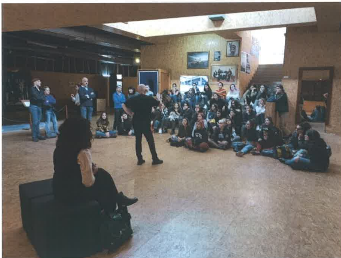
Predavanje u Art Depou Ars Aevi