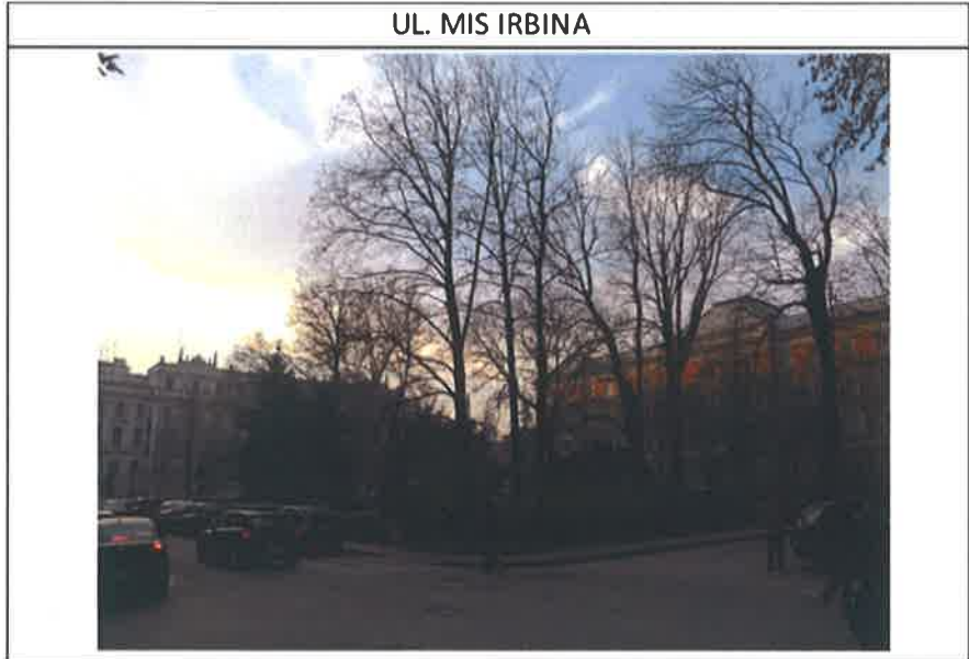
UL. MIS IRBINA