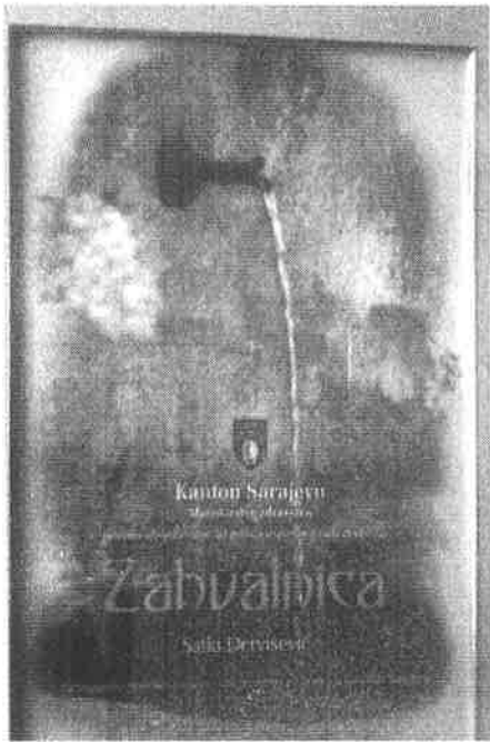
Priznanje Ratnih vojnih invalida Kantona Sarajevo