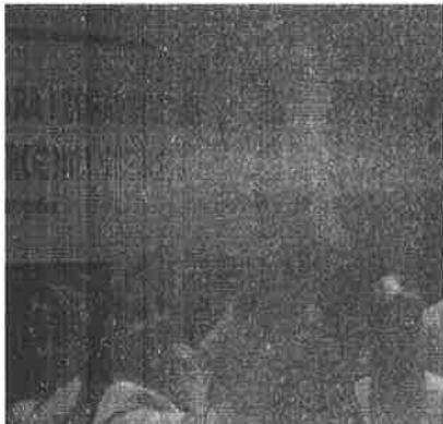
Komora medicinskih sestara Unsko- sanskog Kantona- Djevojka sa Une