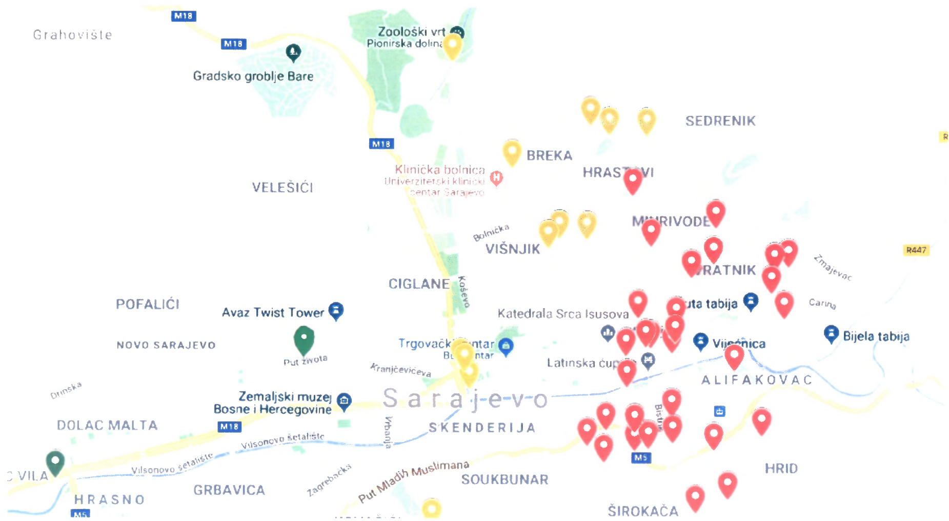
Lokacija česmi i fontana ( ■ Stari Grad, ■ Centar ■ Novo Sarajevo)