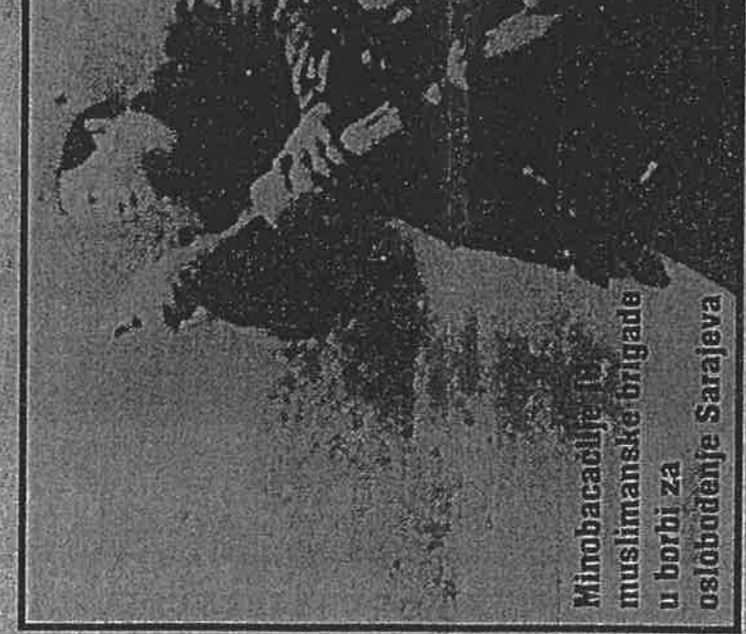
Minobacačije i muslimanske brigade u borbi za oslobođenje Sarajeva

U toku razlika među narodnooslobodilačkim pokretima, predvođenim Josipom Brozom, imao je ulogu u organiziranju i vođenju borbi. U toku razlika među narodnooslobodilačkim pokretima, imao je ulogu u organiziranju i vođenju borbi. U toku razlika među narodnooslobodilačkim pokretima, imao je ulogu u organiziranju i vođenju borbi.