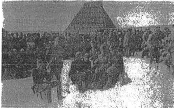
Prijam novih boraca sa Kosova u 20. romanijsku brigadu u rejonu Sokolca, marta 1945.

se 16. i 19. brigada već bile povukle na polazne položaje, neprijatelj izvršio snažan protivnapad i prisilio i nju da odstupi. Slično se desilo i na Čavčevom polju. Njen 4. bataljon, koji je napadao to uporište, ovladao je dijelom rovova, ali mu nije pošlo za rukom da zauzme bun-kere, iako je izvršio tri napada na to uporište. Tokom te noći su je-dinice 20. brigade imale 11 poginulih, 2 nestala, 1 zarobljenog i 22 ranjena borca. 32