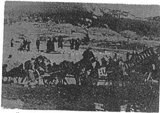
Nastupanje 27. divizije prema Sarajevu, Mokro, 5. aprila 1945.

divizije dao je zadatak političkim komesarima i pomoćnicima političkih komesara brigada i bataljona da za sve teme i programe političke nastave i za konferencije na kojima su objašnjavani tekući politički događaji, vrše pripreme političkih komesara u batalj onima odnosno u četama. U periodima predaha, dok su glavne brigade ili bataljona bile na okupu, nemali broj tih predavanja i konferencija su držali brigadni rukovodioci. 46