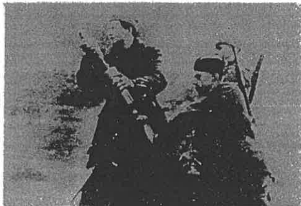
Minobacač 16. muslimanske brigade u dejstvu na Romaniji, marta 1945.

ri, prešla u odbranu koja je prvenstveno bila diktirana operativnim potrebama da se bolje usklade i povežu dejstva svih snaga JA koje su angažovane u borbama za oslobođenje Sarajeva. Međutim, zatišje od 7 do 8 dana nije iskorišćeno samo za pripremanje jedinica za naredne zadatke nego i za napade pojedinih brigada ili bataljona na neprijatelja ispred fronta divizije i na drumu preko Romanije. U okviru tih borbenih poduhvata najznačajniji su bili pokušaji da se ovlada Velikom Gradinom i da se tako slomi desno krilo njemačke odbrane na Glasincu.