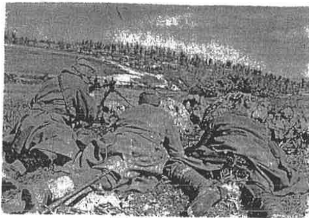
Djelovi 27. divizije u dsjstvu na Romaniji, mart 1945.

Gradnine (trig. 994) do zaključno Čavčevog polja na Romaniji (skica br. 24). Stab divizije riješio je da sa dijelom snaga savlada neprijateljevu odbranu u širem rejonu Podromanije, a sa drugim dijelom da, u sadejstvu s jedinicama 38. divizije, presječe drum između Čavčevog polja i Crvenih stijena. Napad je organizovao u tri napadne kolone: desna, dva bataljona 16. muslimanske brigade, trebalo je da ovlada položajima ispred kasarne u Podromaniji i kod Spomenika (k. 869) i sadejstvuje 19. brigadi u zauzimanju kasarne; srednja, 19. birčanska brigada, predviđeno je da prvo zauzme Veliku Gradinu (trig. 944) i Pliješ (k. 981), a onda kasarnu i položuje neposredno oko nje; i, lijeva kolona, 20. romanijska brigada, imala je zadatak da sa iužne strane sa dva bataljona napadne i zauzme Karaulu, a sa jednim Čavčevo polje. Poslije toga trebalo je da preduzme gonjenje neprijatelja i izvrši napad na Crvene stijene. 25